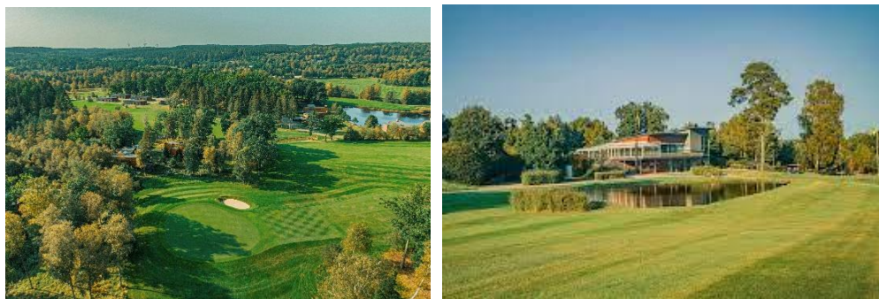
WOODLANDS COUNTRY CLUB , Rya 472, 286 91 Örskälljunga, Sverige.

Vi gentager vores 2023 tur til denne golfbane, idet vi finder den super fin til prisen og opholdet. Woodlands Country Club er en danskejet 27 hullers golfresort, hvor du kan bo i arkitekttegnede luksushuse eller på hotellet midt på golfbanen i den smukke skånske natur; en storslået golfoplevelse. Link: https://woodlands.se/golfpaket/